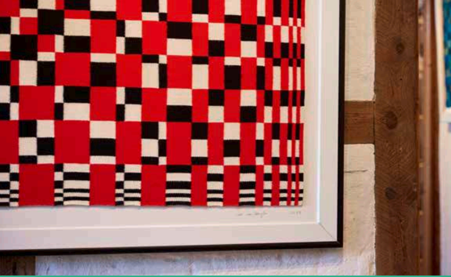
Eichenhof – Keramik und Stoffe in ihrer schönsten Form: natürlich, handgefertigt, unverwechselbar